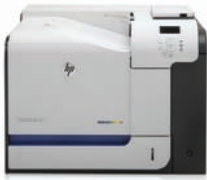
HP Color LaserJet Enterprise 500 M551dn