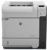
HP LaserJet Enterprise 600 M603dn